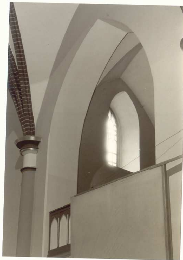
WNĘTRZE- CHÓR, ŚCIANA POŁUDNIOWA.