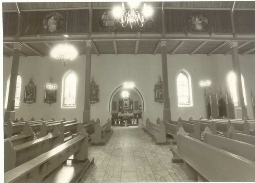
ŚCIANA POŁUDNIOWA, W GŁĘBI KAPLICA MATKI BOSKIEJ RÓŻAŃCOWEJ..