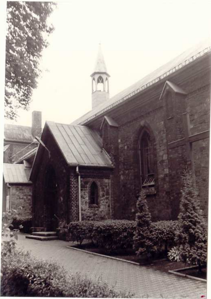
FRAGMENT ELEWACJI PÓLNOOCNEJ Z WIEŻYCZKĄ NA SYGNATURKĘ.