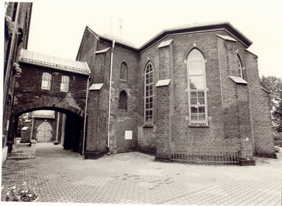
FRAGMENT ELEWACJI OD STRONY POŁUDNIOWO-WSCHODNIEJ Z TZW. „ŁĄCZNIKIEM”