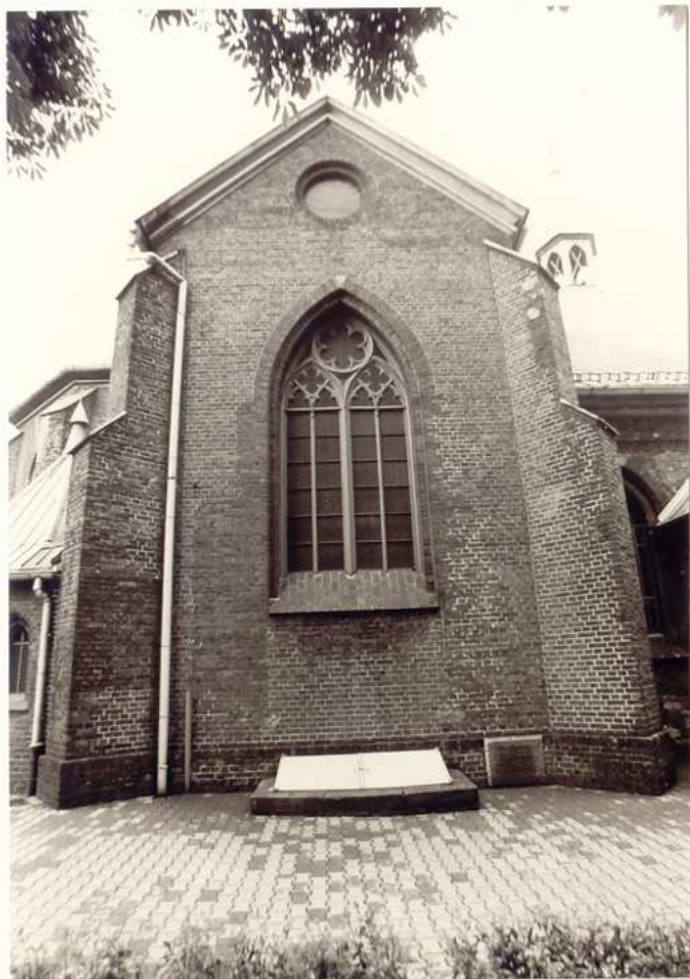
SKRZYDŁO PÓLNOCNE TRANSEPTU.