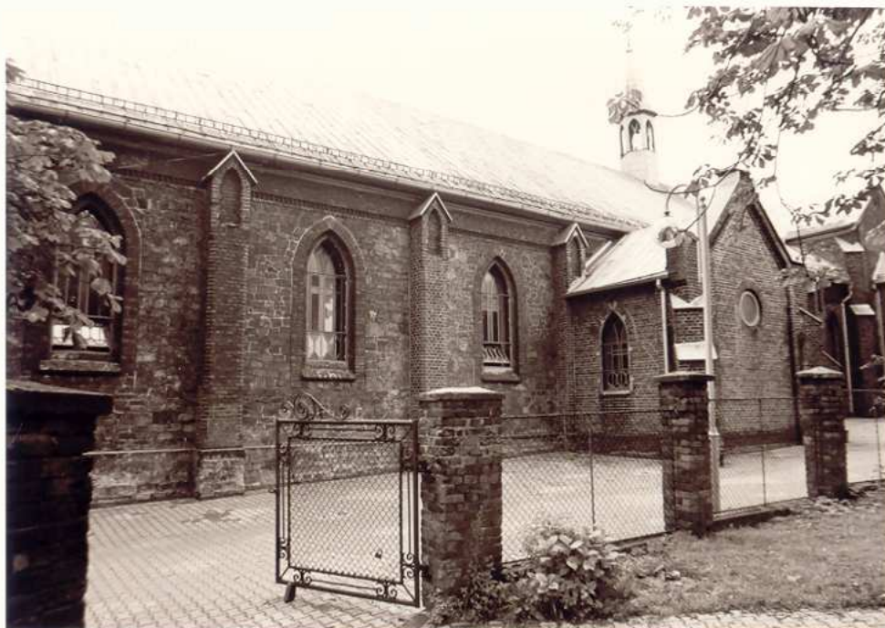
ELEWACJA POŁUDNIOWA Z FRAGMENTEM OGRODZENIA.