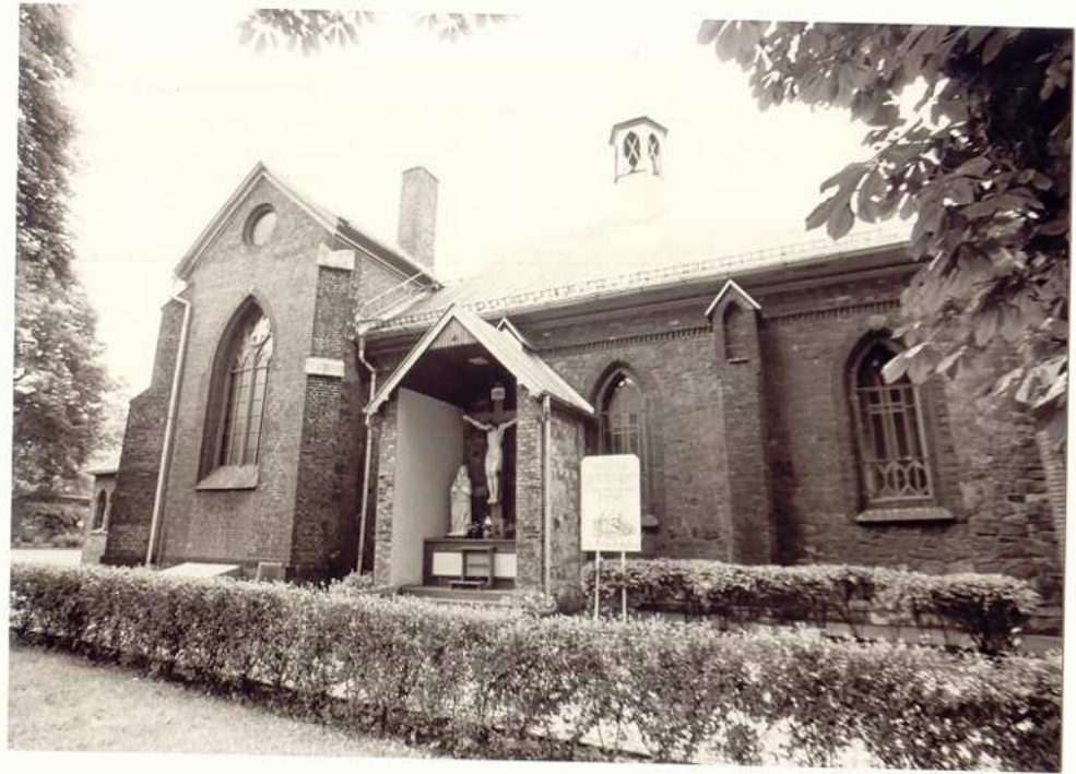
FRAGMENT ELEWACJI PÓLNOOCNEJ Z GRUPĄ KALWARII.