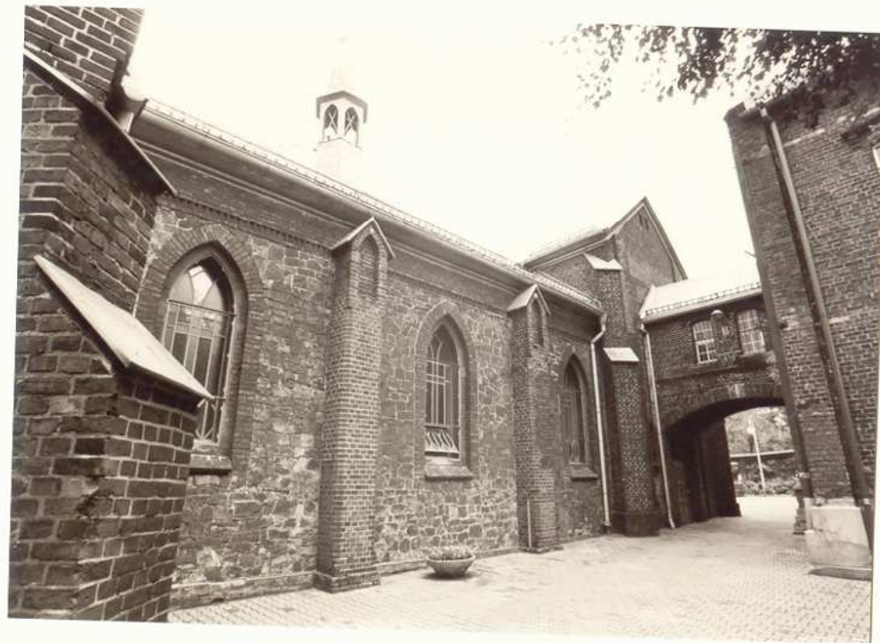
FRAGMENT ELEWACJI POŁUDNIOWEJ Z WEJŚCIEM DO ZAKRYSTII.