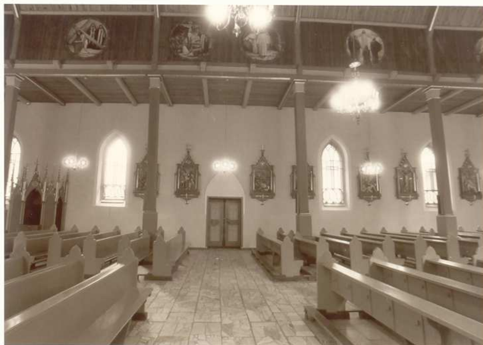
WNĘTRZE- ŚCIANA PÓLNOCNA