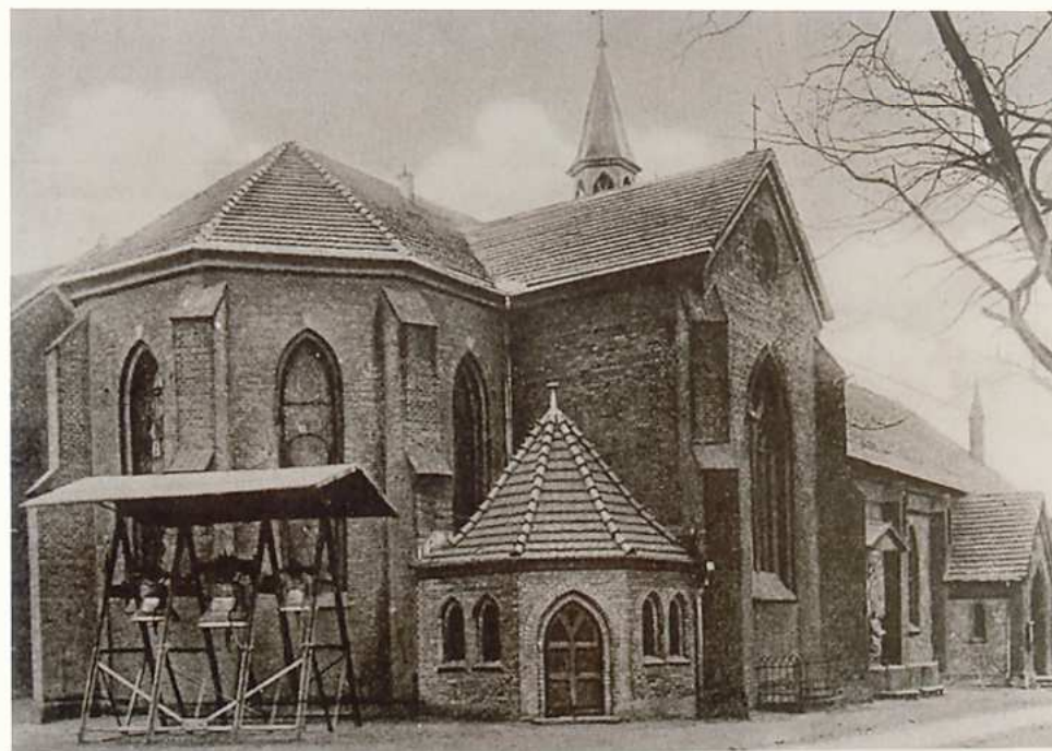
KOŚCIÓŁ MATKI BOSKIEJ RÓŻAŃCOWEJ. WIDOK Z LAT 30-TYCH /REPRODUKCJA/.