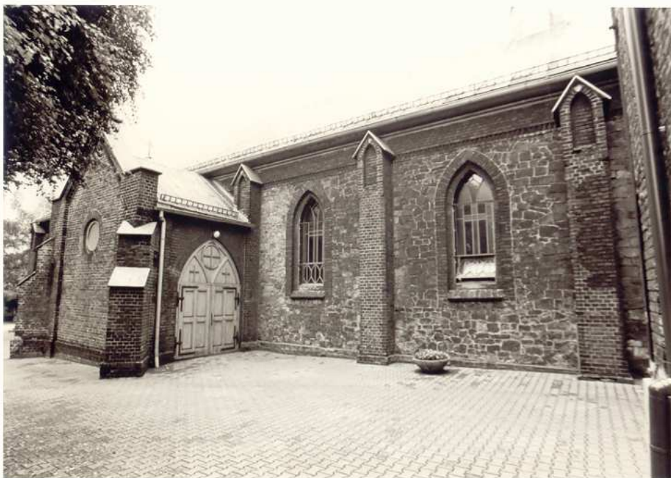
KAPLICA MATKI BOSKIEJ RÓŻAŃCWEJ.