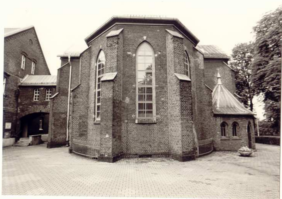
WIDOK KOŚCIOŁA OD STRONY PREZBITERIUM.