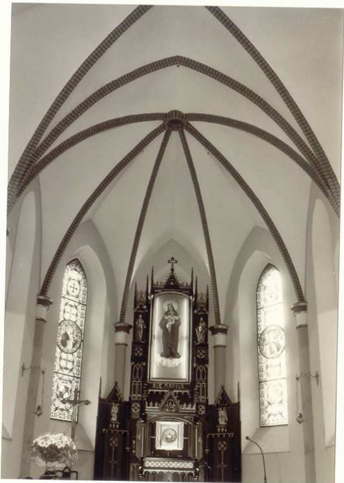
FRAGMENT PREZBITERIUM ZE SKLEPIENIAMI