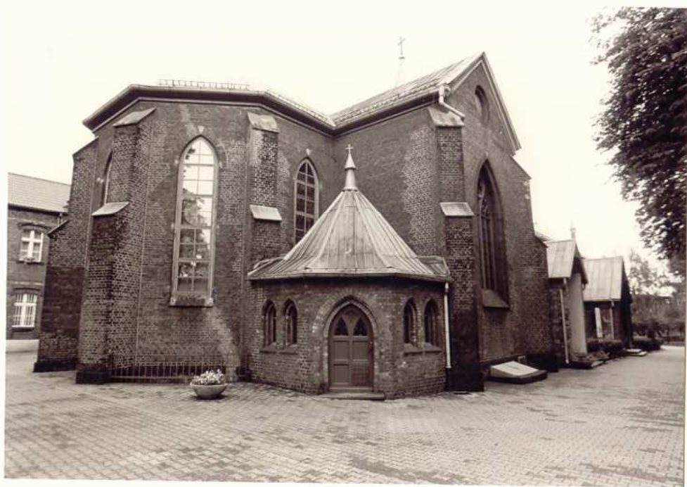
ELEWACJA PÓLNO-CNO-WSCHODNIA KOŚCIOŁA.