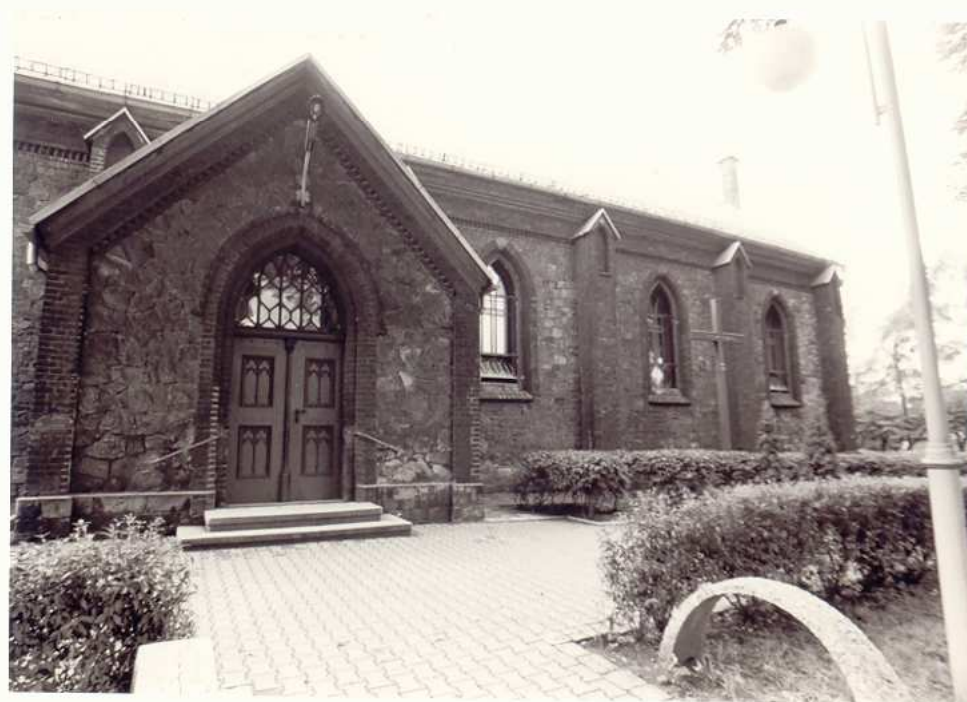
FRAGMENT ELEWACJI PÓLNOCNEJ.