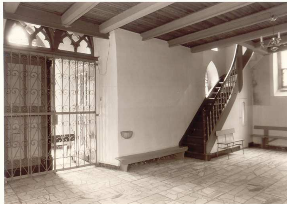
WEJŚCIE GŁÓWNE ORAZ FRAGMENT SCHODKÓW PROWADZĄCYCH NA EMPORE ORGANOWĄ.