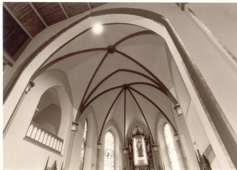
FRAGMENT LUKU TĘCZOWEGO ORAZ PREZBITERIUM Z CHÓREM NA ŚCIANIE PÓLNOCNEJ.