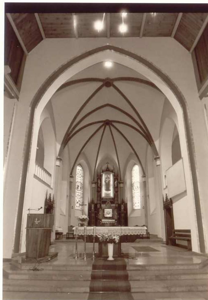
WIDOK NA PREZBITERIUM.