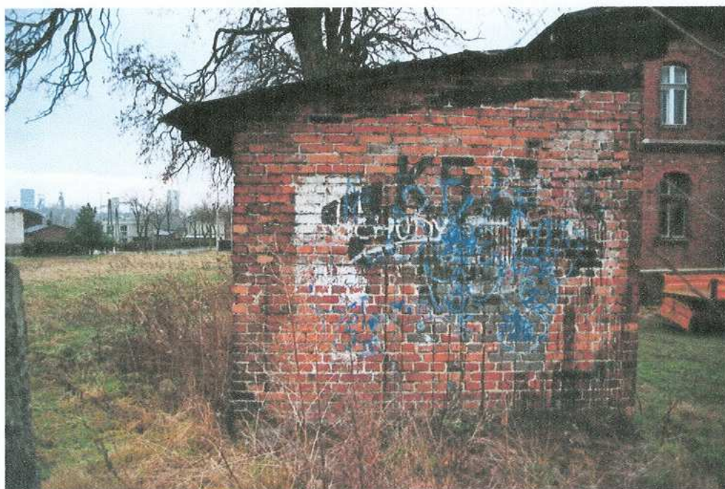
31. Budynek gospodarczy – elewacja boczna - północna