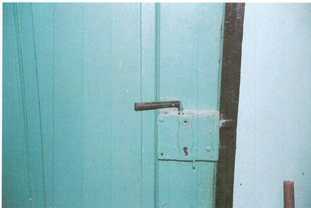
11. Zamek drzwi do piwnicy