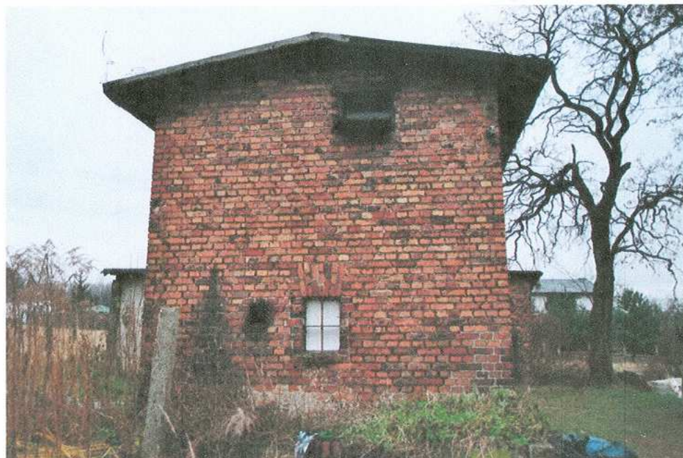
27. Komórka gospodarcza – elewacja zachodnia