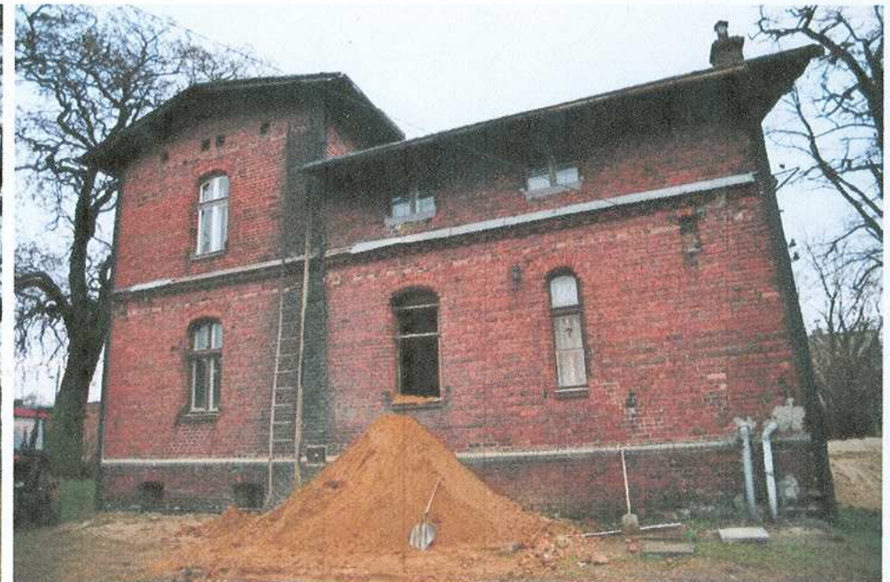
2. Elewacja północna