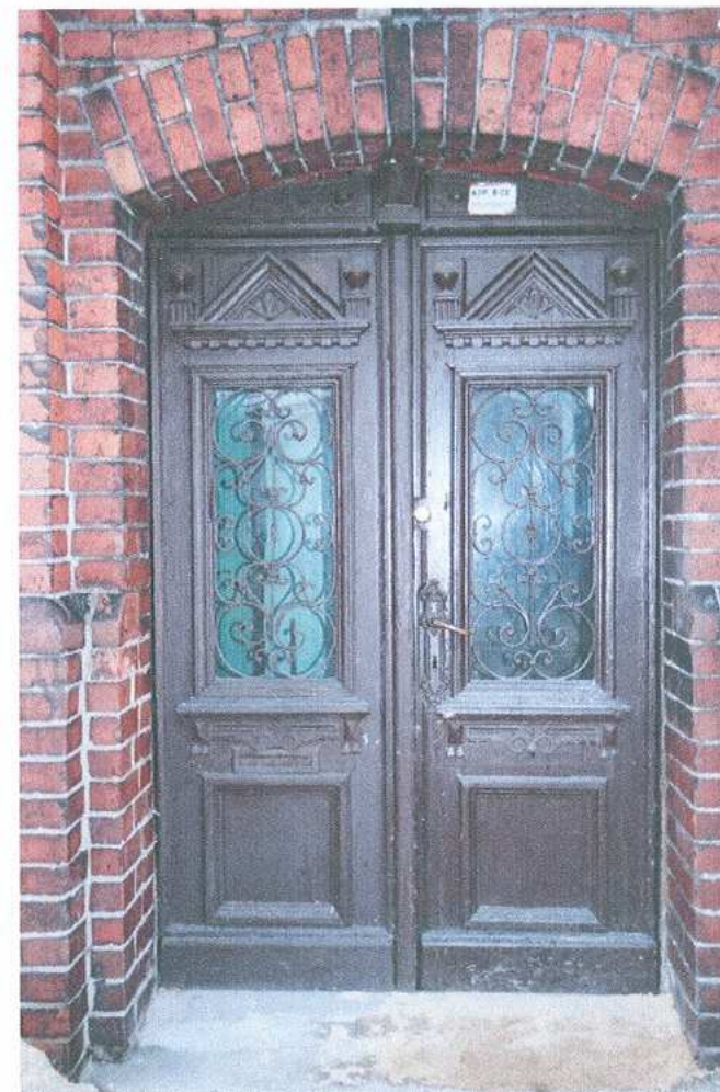
6. Wejście od zachodu