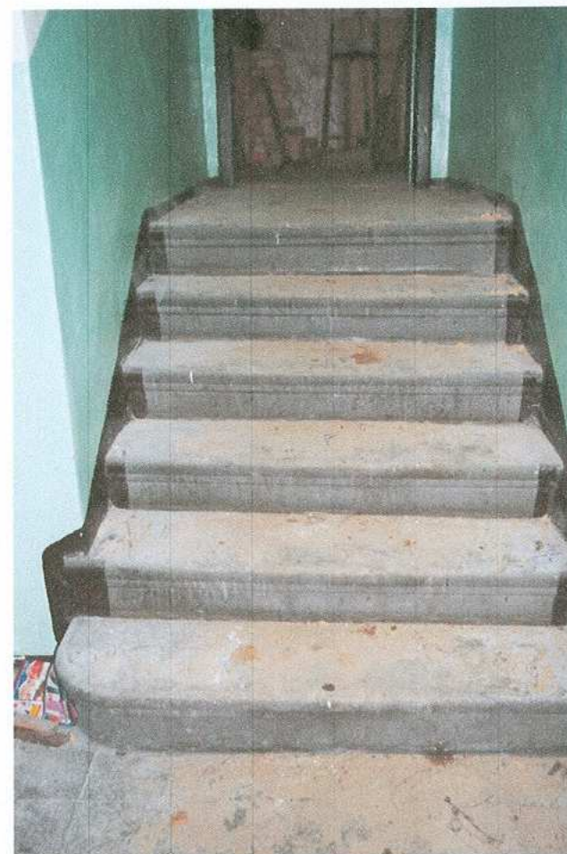
14. Kratownica - stężenia