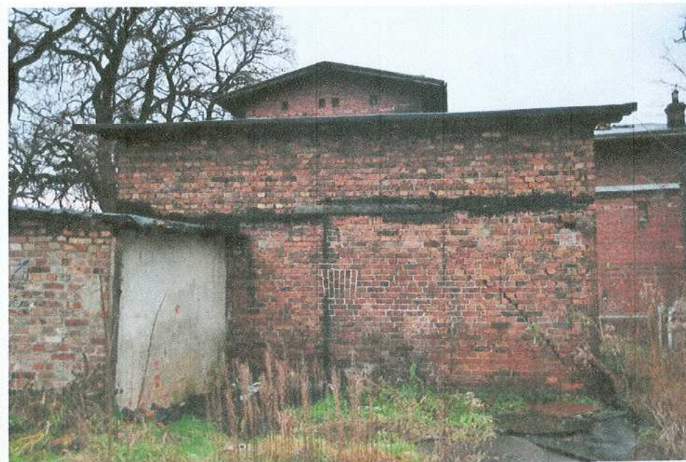
28. Komórka gospodarcza – elewacja tylna