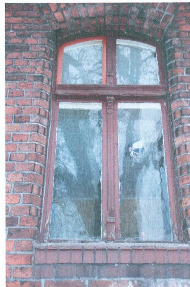
8. Okno w elewacji wschodniej