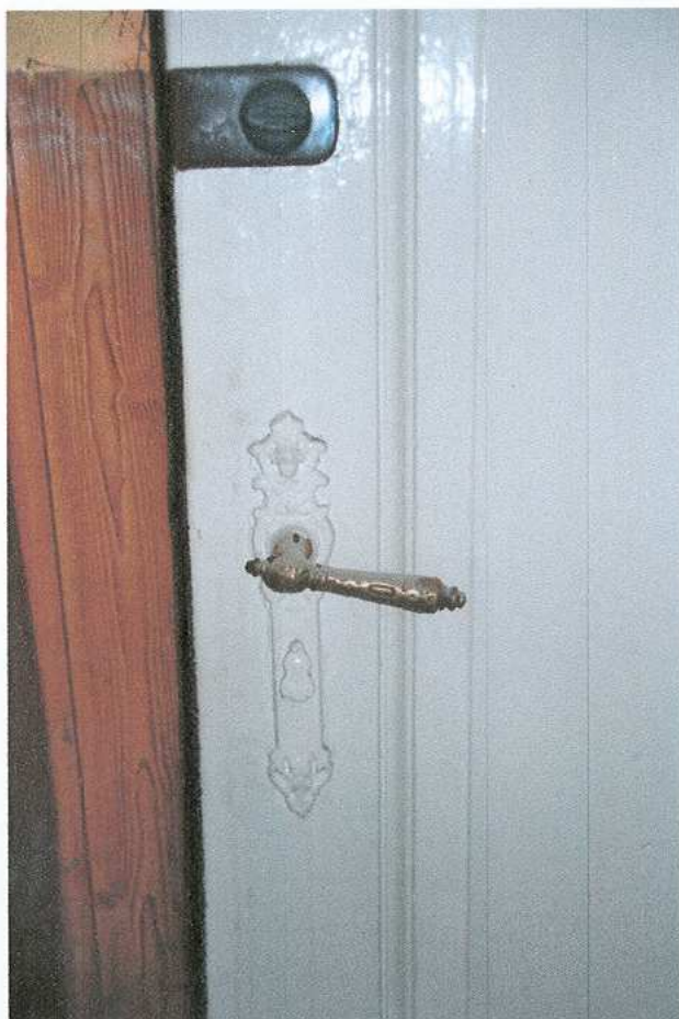
21. Szyld i klamka drzwi do pokoi