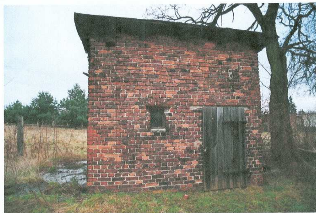
30. Budynek gospodarczy – elewacja zachodnia