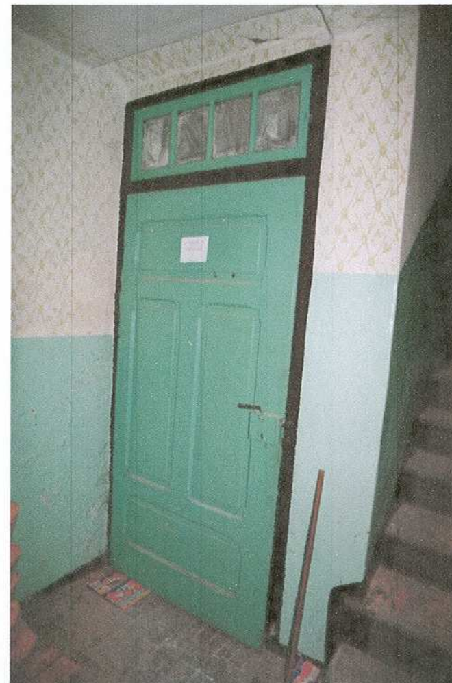
10. Drzwi do piwnicy