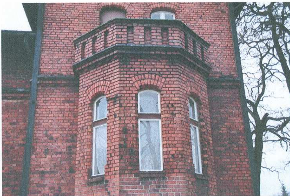
5. Ryzalit w elewacji południowej