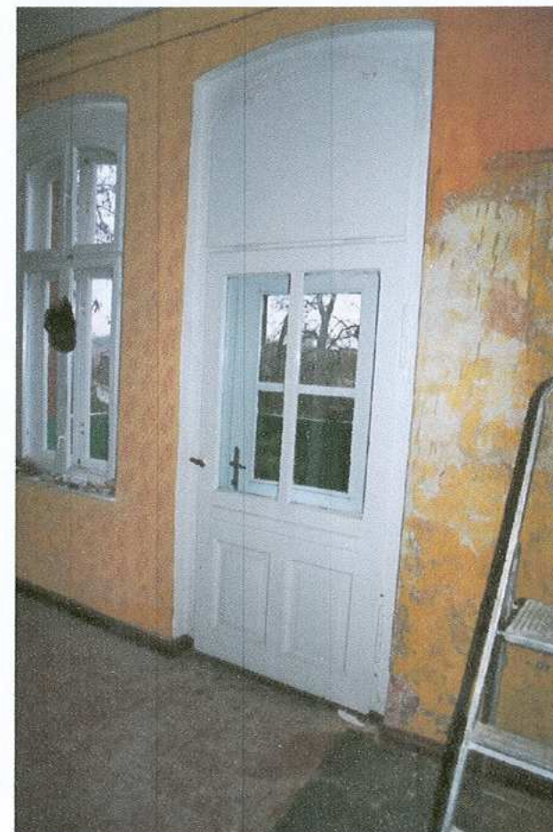
18. Drzwi balkonowe na piętrze