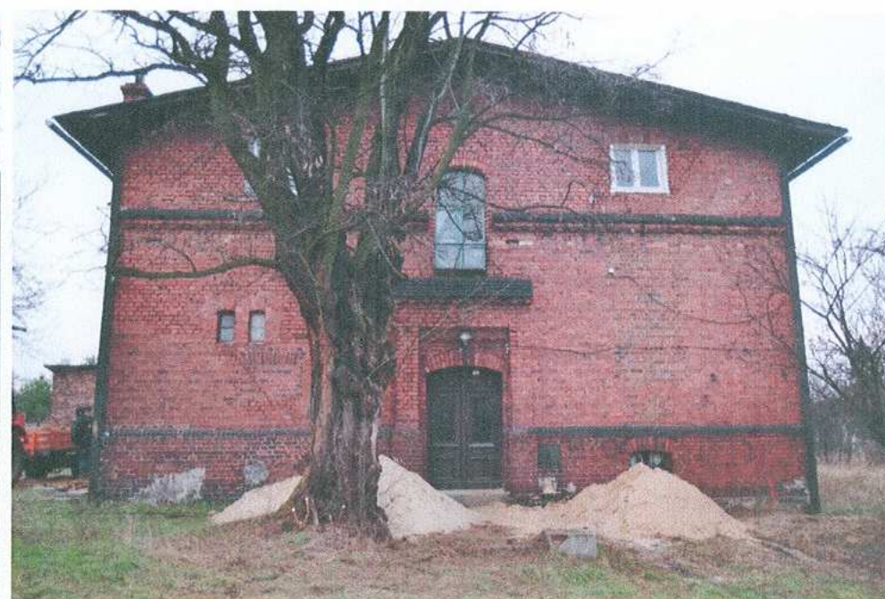
4. Elewacja zachodnia