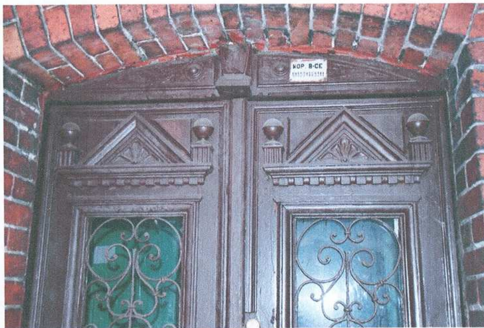
7. Wejście od zachodu - detal