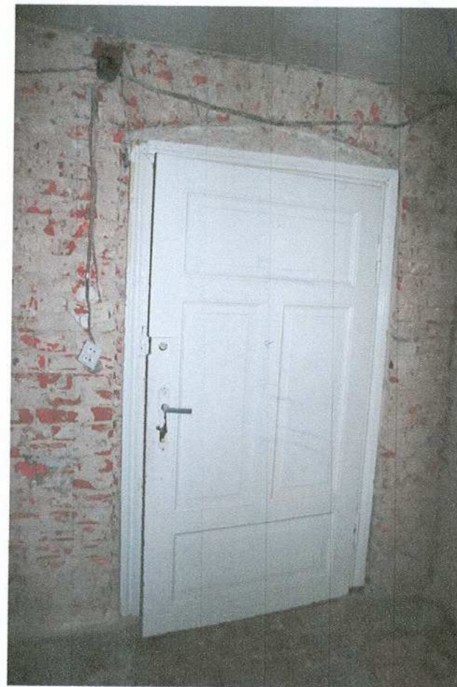
20. Drzwi do pokoi