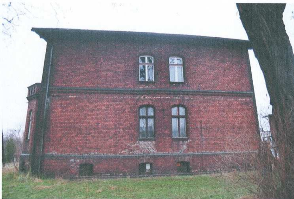
3. Elewacja wschodnia