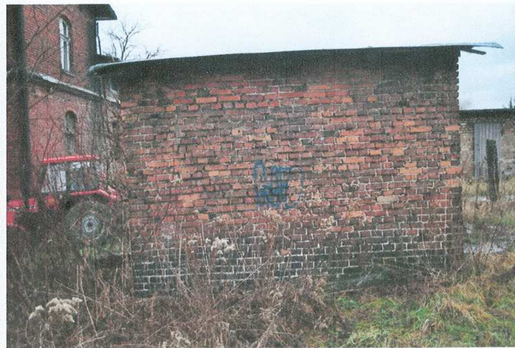
32. Budynek gospodarczy – elewacja wschodnia