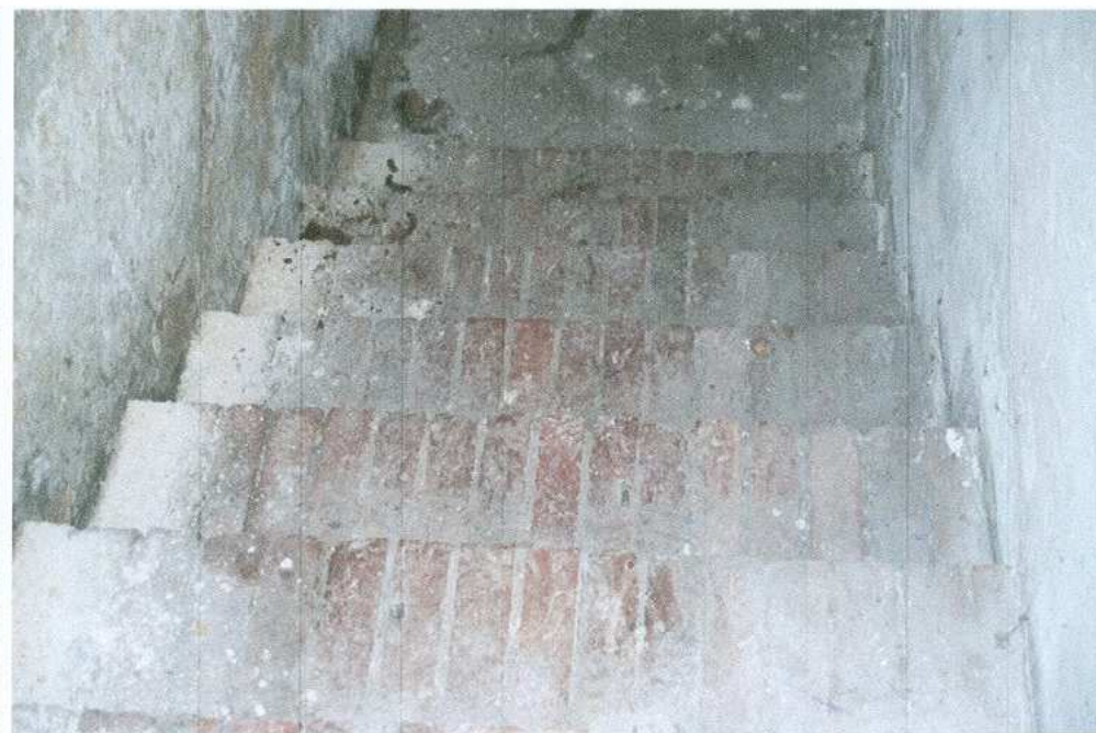
12. Schody do piwnicy