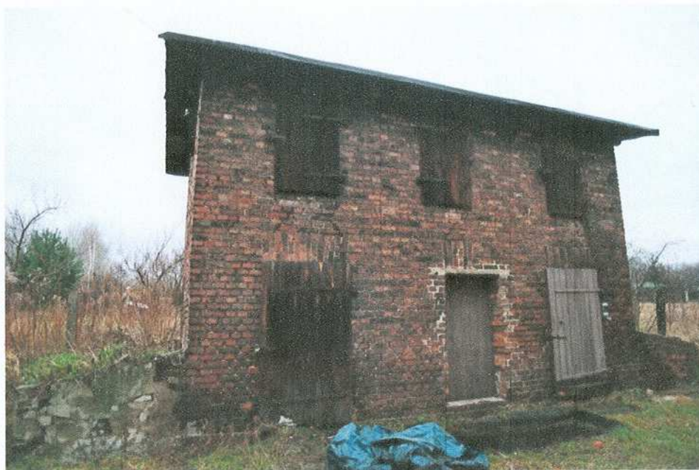
25. Komórka gospodarcza – elewacja południowa