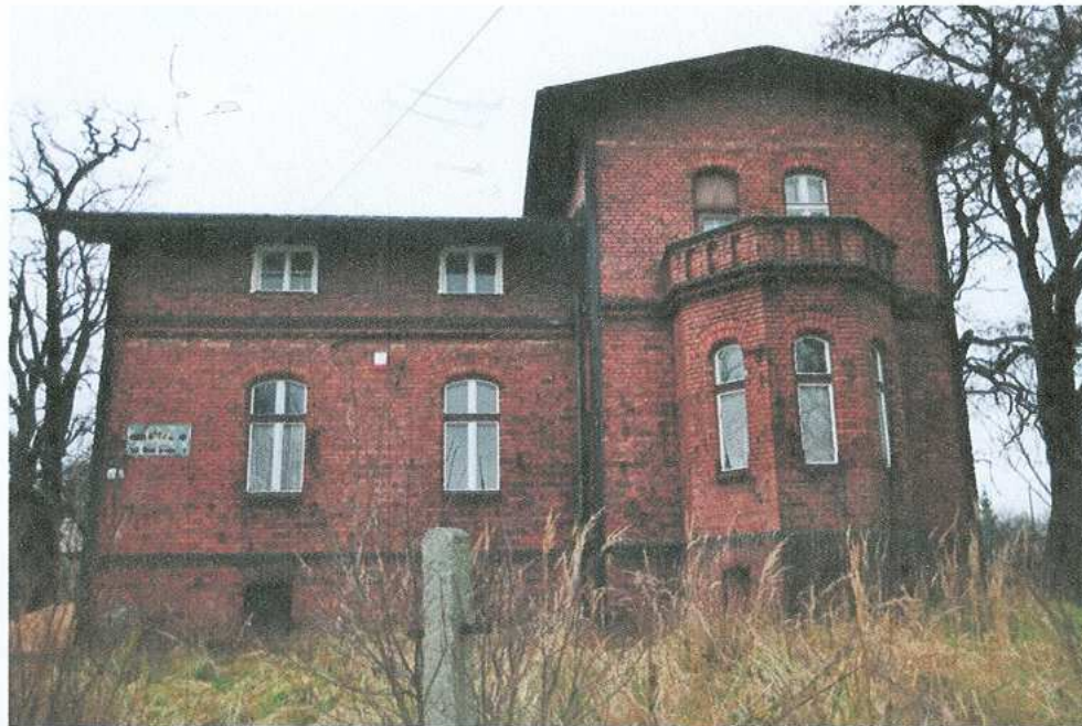
1. Elewacja południowa