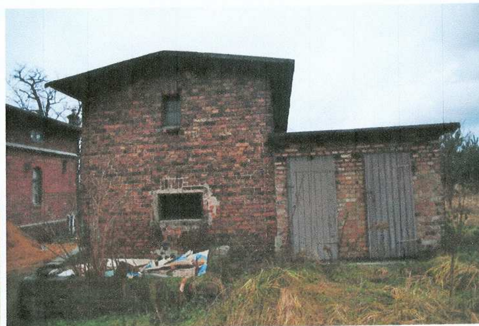
26. Komórka gospodarcza – elewacja wschodnia