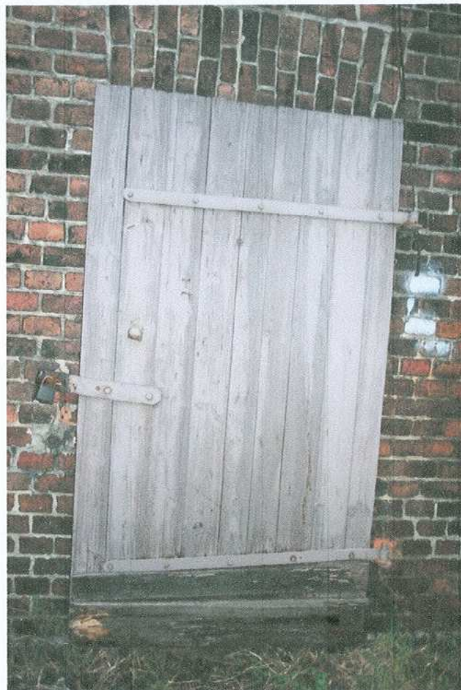
29. Komórka gospodarcza – drzwi do komórki