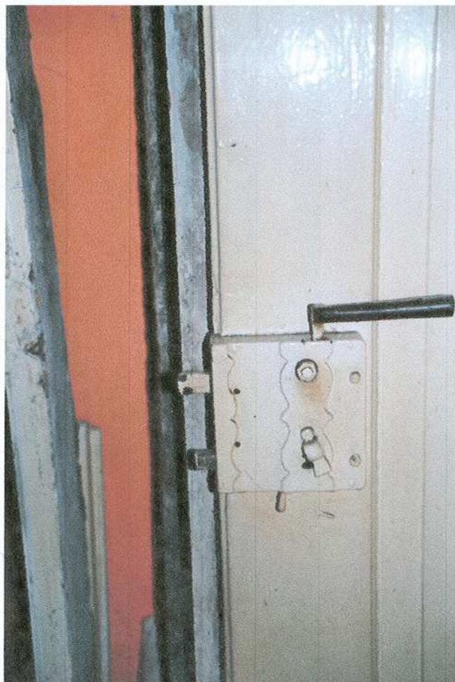
23. zamek zewnętrzny drzwi (obecnie zdjętych)