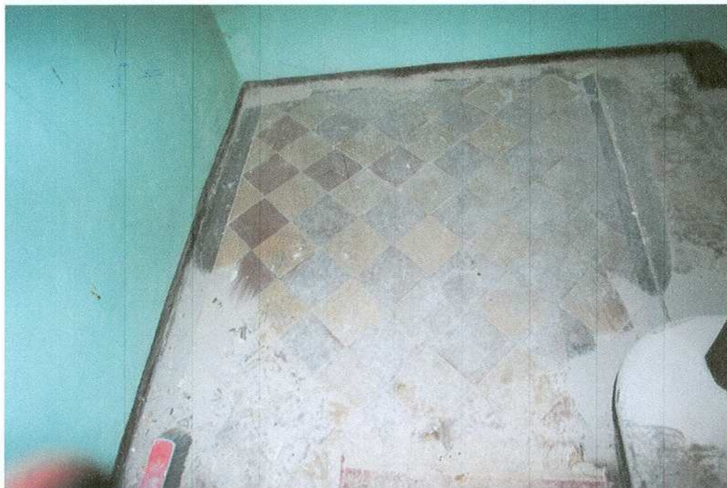
17. Pierwotna posadzka na podeście schodów