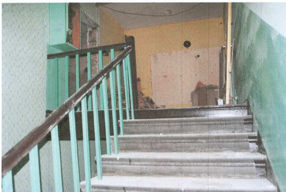
15. Główna klatka schodowa