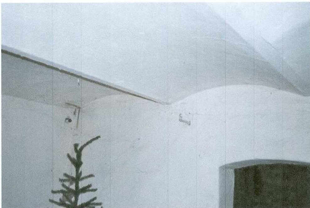
13. Strop ceramiczny odcinkowy w piwnicy