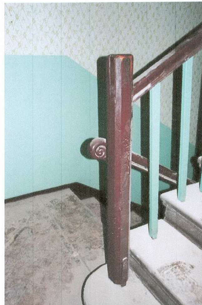
16. Schody główne - detal