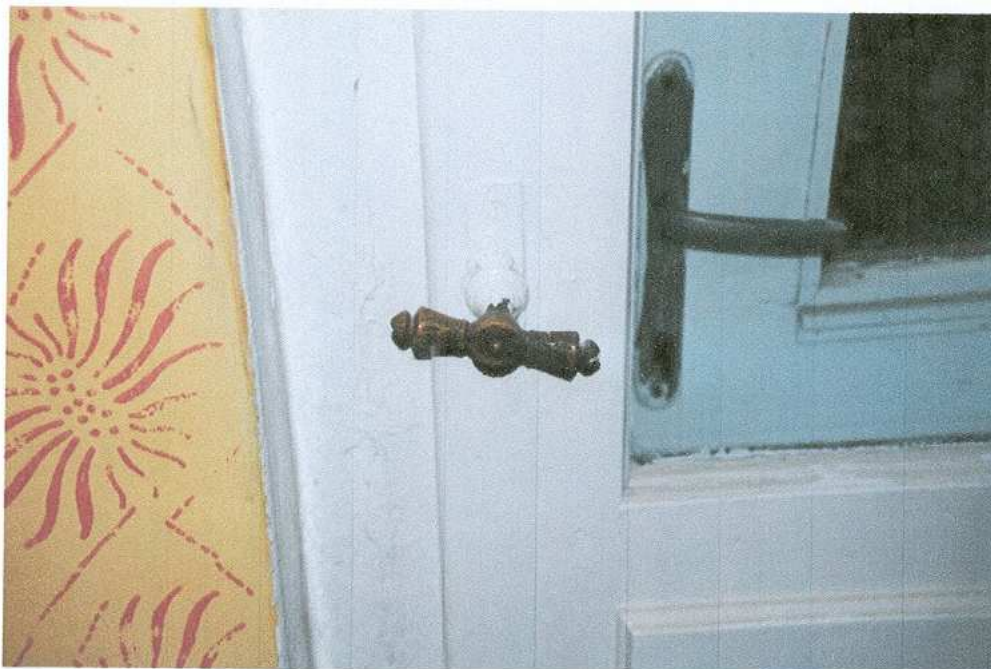
19. Klamka drzwi balkonowych