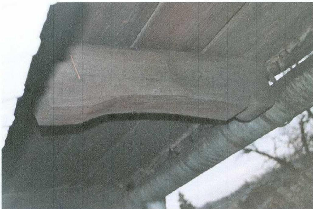
9. Ozdobna końcówka krokwi podtrzymującej okap