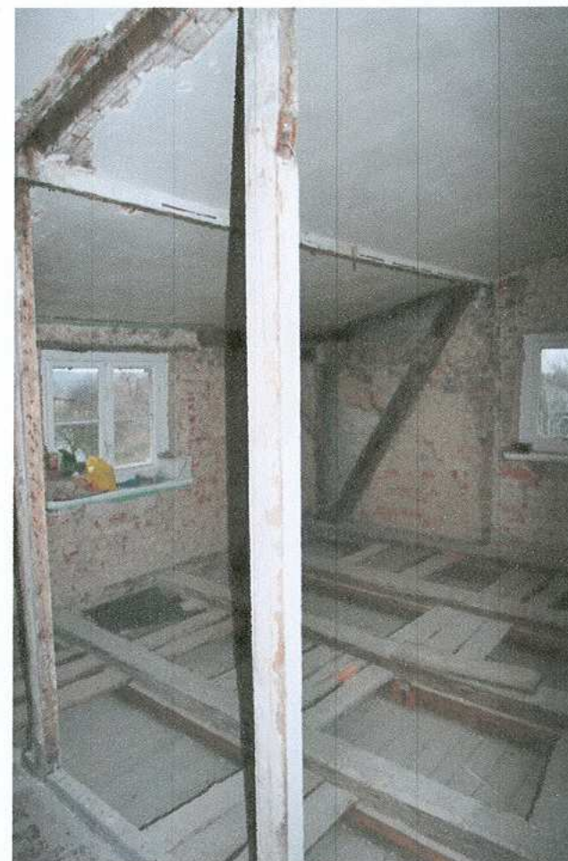
24. Więźba dachowa i ścianka kolankowa