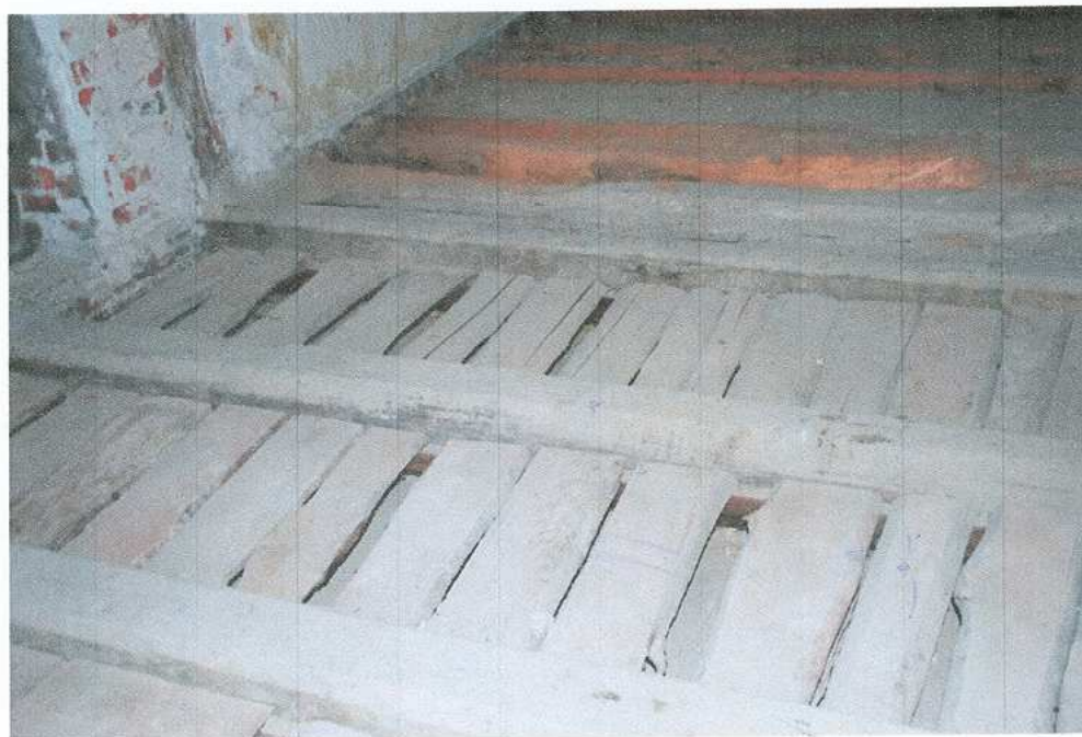
22. Ślepy pułap