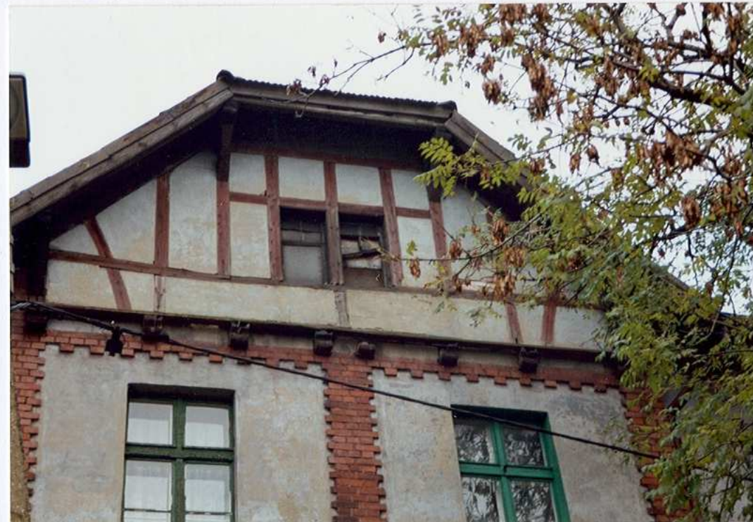
fragment szczytu od strony zachodniej