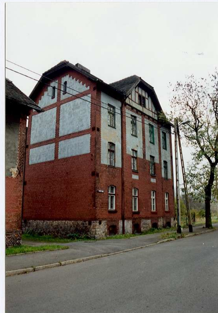
widok od północnego - zachodu