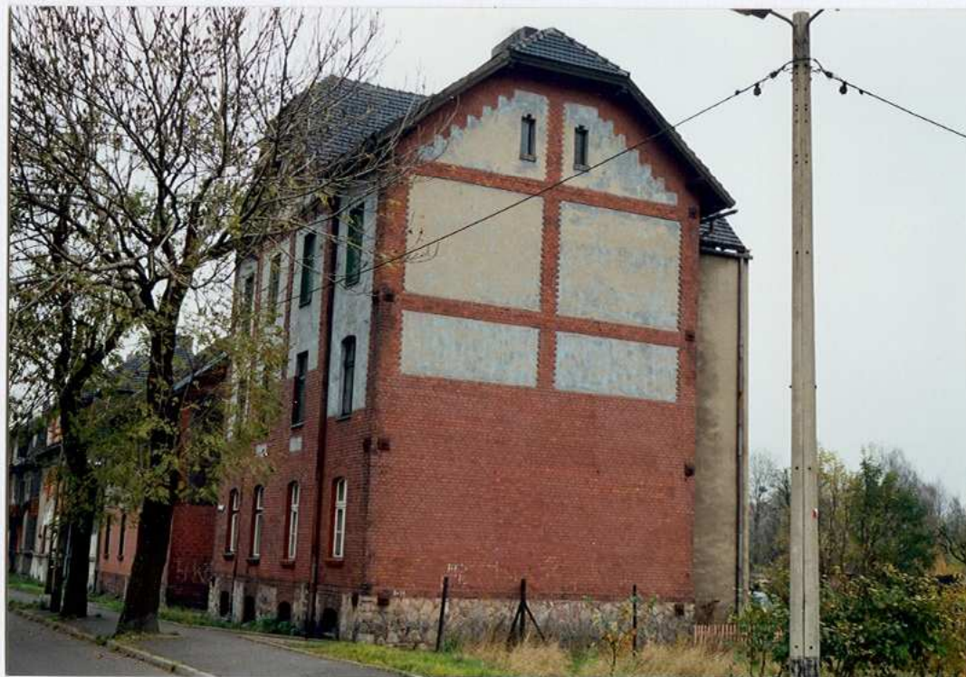
widok od południowego - zachodu