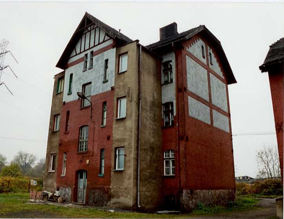
Zdjęcie rzut przekrój sytuacja orientacja