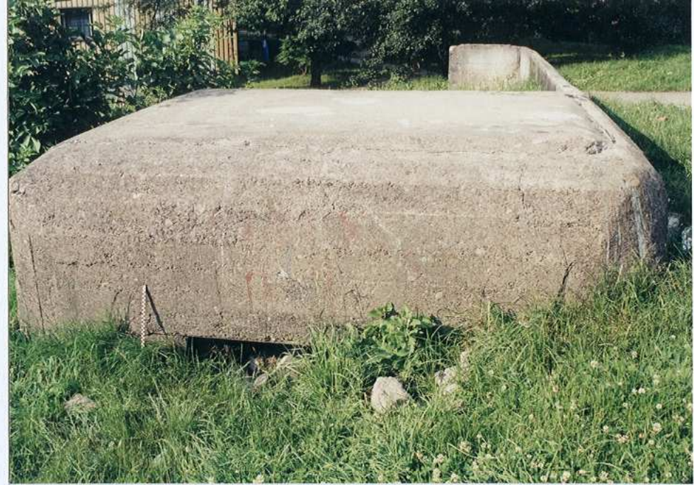
Widok od strony południowo- zachodniej