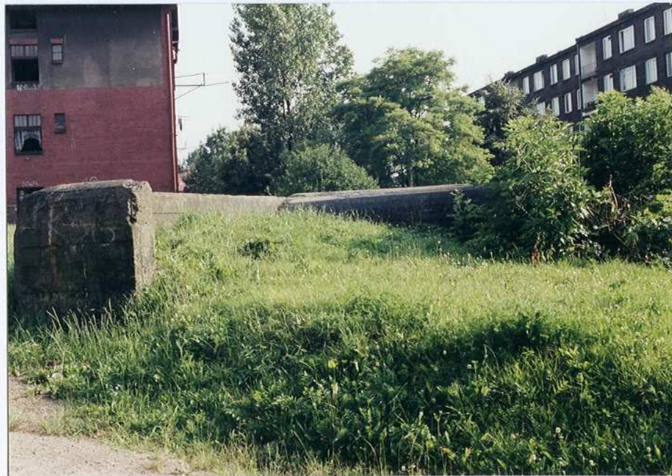
Widok od strony północnej