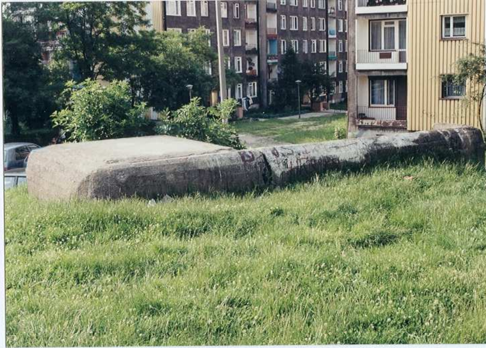
Widok od strony południowej