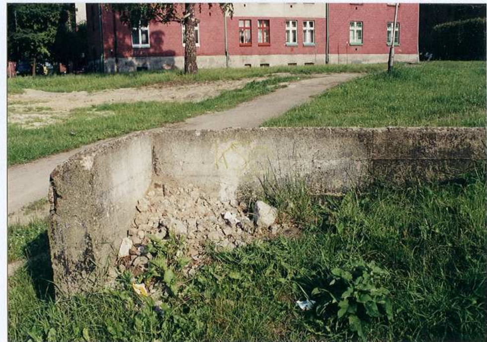
Wnętrze części pozornej