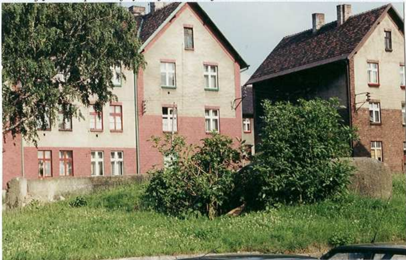
Widok ogólny od zachodu

11. Zdjęcie rzut przekrój sytuacja orientacja