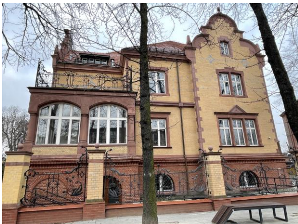
elewacja frontowa budynku

województwo: śląskie powiat: Ruda Śląska gmina: Ruda Śląska