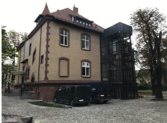
Elewacja tylna budynku