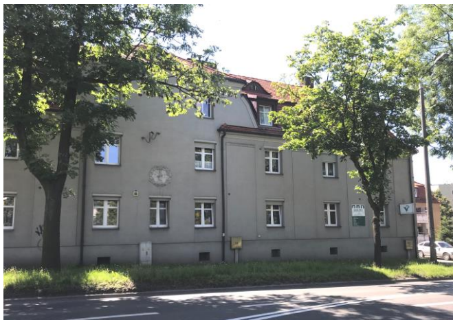
Elewacja frontowa budynku