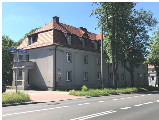
Widok z północy