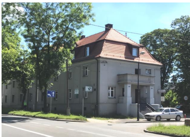
Widok z zachodu