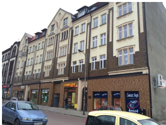
widok od północno-zachodu