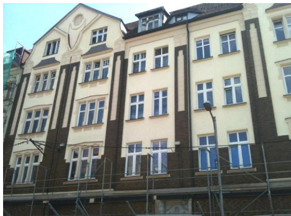
widok od północy

§8 ust. 2 tab.2 poz. 187 MPZP miasta Ruda Śląska ( uchwała nr PR.0007.59.2018 z dnia 22 marca 2018 r., ogłoszona w Dz. Urz. Woj. Śląskiego z 2018 r., poz. 2701)