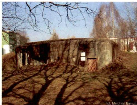
Zdjęcie nr 1. Widok od południowej strony