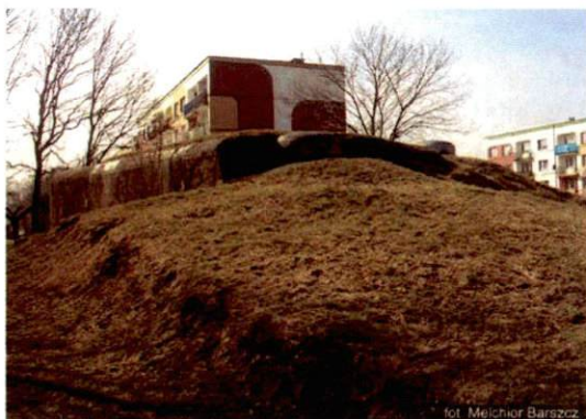
Zdjęcie nr 3. Widok od północy