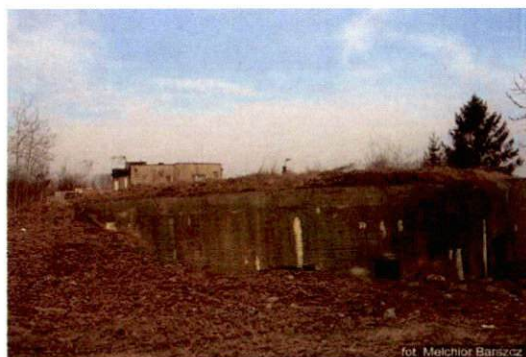
Zdjęcie nr 5. Widok od wejścia (zasypane)