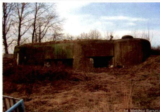
Zdjęcie nr 4. Widok od północnego wschodu