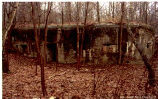
Zdjęcie nr 125. Widok od południa