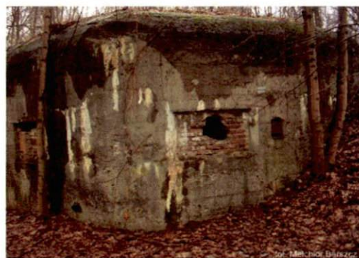
Zdjęcie nr 124. Widok od zachodu