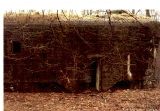
Zdjęcie nr 128. Widok od północy