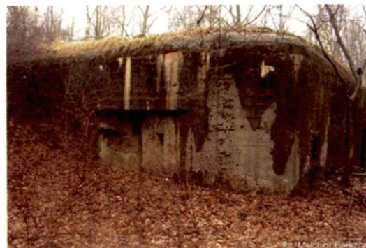
Zdjęcie nr 129. Widok od wschodu