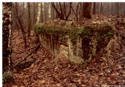
Zdjęcie nr 131. Widok od północnego-zachodu