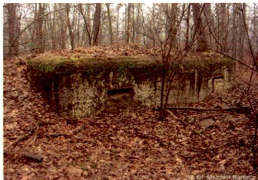
Zdjęcie nr 132. Widok od północnego-wschodu