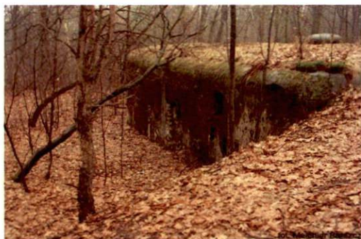
Zdjęcie nr 135. Widok od północnego-zachodu