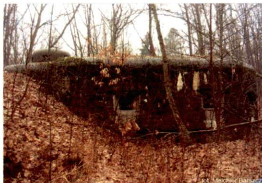
Zdjęcie nr 133. Widok od wschodu