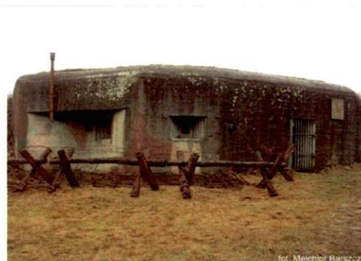
Zdjęcie nr 136. Widok od północnego-wschodu