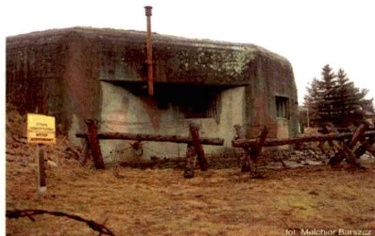
Zdjęcie nr 138. Widok od południowego-wschodu