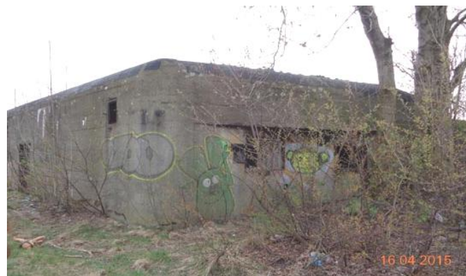
widok od zachodu