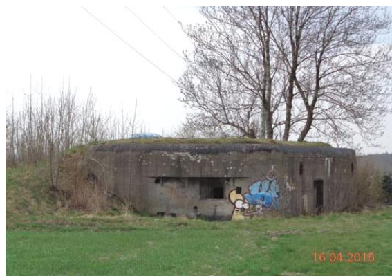
widok od wschodu