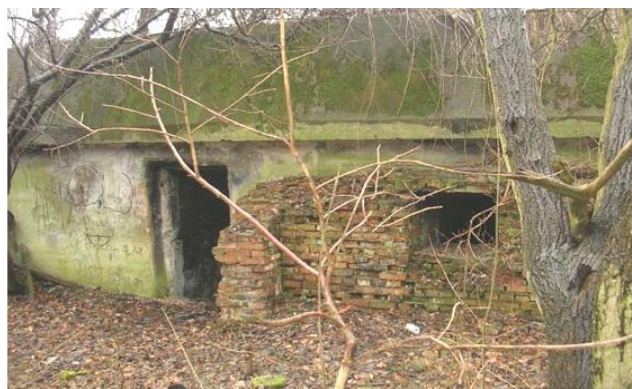
widok od północy