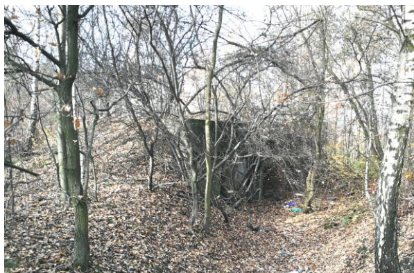
widok od południowego-wschodu

schron bierny magazynowy wraz z otoczeniem, na terenie pozostającym w granicach oddalonych od obrysu zewnętrznego murów o 5 m po zachodniej stronie, w linii granicy działki po stronie północnej i wschodniej, o 25 m po południowej stronie