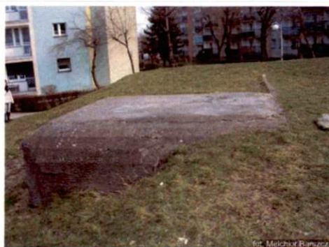
Zdjęcie nr 10. Widok od południowego-zachodu