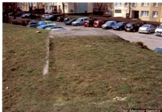
Zdjęcie nr 11. Widok od północnego-wschodu