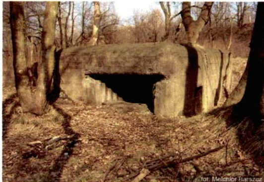
Zdjęcie nr 20. Widok od południa