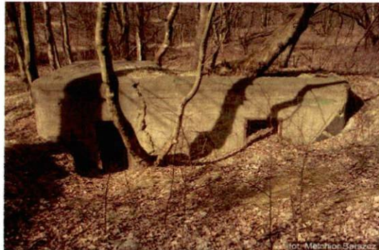
Zdjęcie nr 19. Widok od wschodu

8. Fotografia z opisem wskazującym orientację