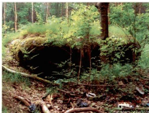
Zdjęcie nr 104. Widok od zachodu