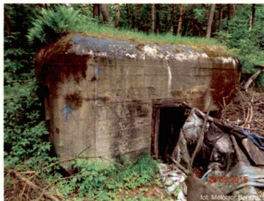
Zdjęcie nr 105. Widok od południowego-wschodu