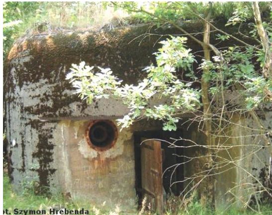
widok od południowego-wschodu

7. Fotografia z opisem wskazującym orientację w stosunku do sąsiednich terenów lub stron świata albo mapa z zaznaczonym stanowiskiem archeologicznym