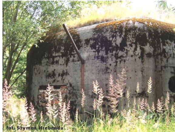
widok na strzelnicę