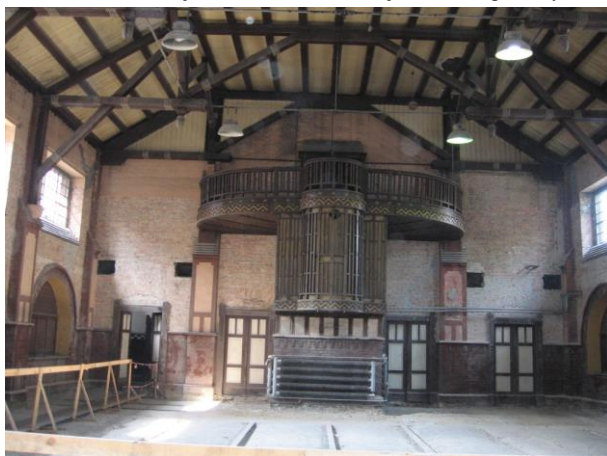
Widok wnętrza sali zbornej

granice wpisu: budynek sali zbornej, dawnej łaźni i szatni łańcuszkowej wraz z najbliższym otoczeniem