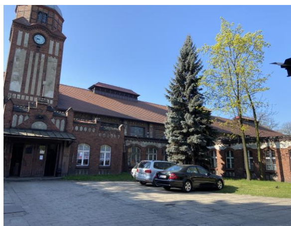
Widok od strony północnego wschodu