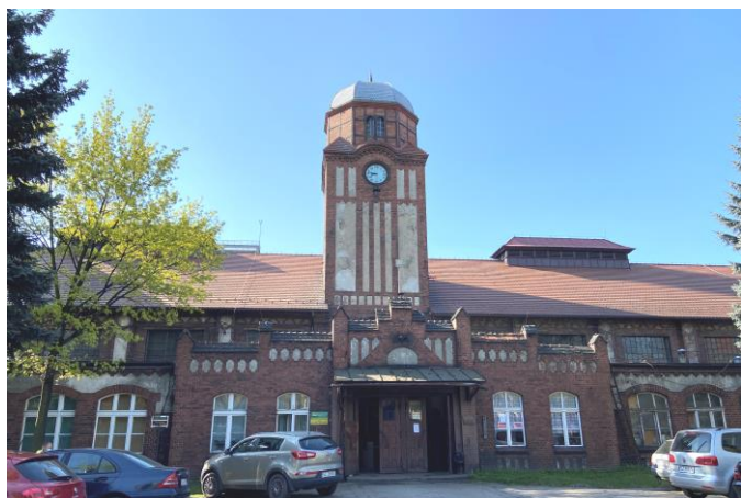
Elewacja frontowa sali zbornej, widok od północy

7. Fotografia z opisem wskazującym orientację w stosunku do sąsiednich terenów lub stron świata albo mapa z zaznaczonym stanowiskiem archeologicznym