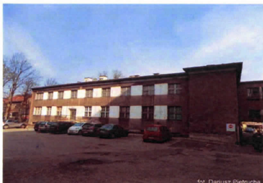
Zdjęcie nr 8. Widok od południa