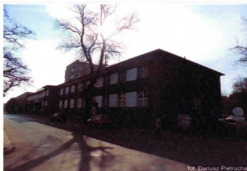
Zdjęcie nr 7. Widok z północnego-zachodu