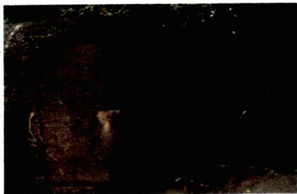
Zdjęcie nr 69. Widok od południowo-zachodu