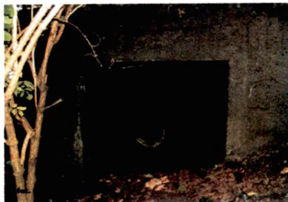
Zdjęcie nr 70. Widok od zachodu