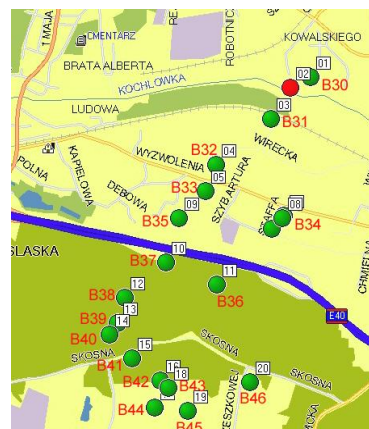
schemat sektora Szybu Artura