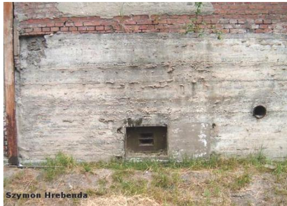
widok od południa