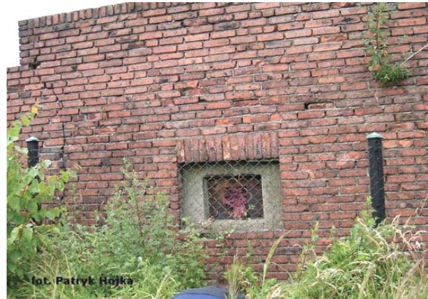
widok od wschodu