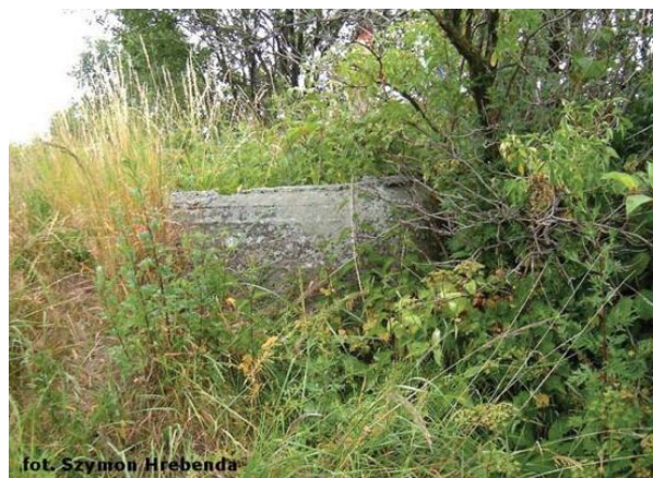
widok od północnego-wschodu