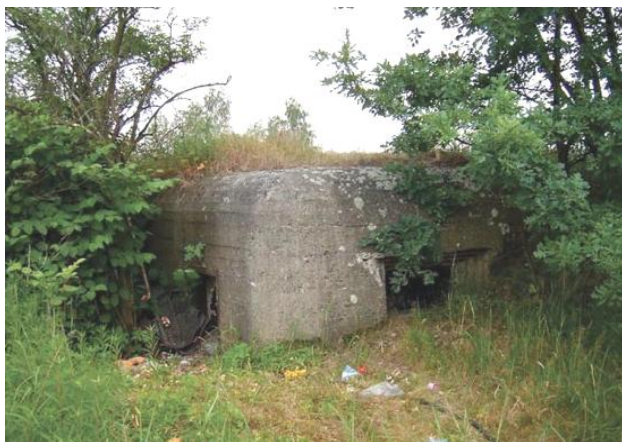
widok od południowego-wschodu

7. Fotografia z opisem wskazującym orientację w stosunku do sąsiednich terenów lub stron świata albo mapa z zaznaczonym stanowiskiem archeologicznym