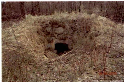
Zdjęcie nr 92. Widok od północy - wyrwana półkopuła