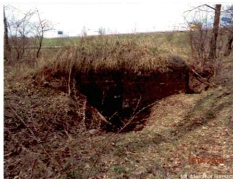
Zdjęcie nr 93. Widok od południa