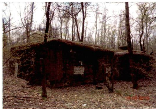
Zdjęcie nr 94. Widok od północnego-wschodu