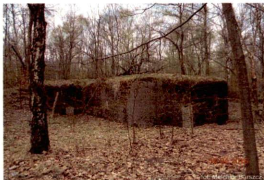
Zdjęcie nr 97. Widok od południowego-wschodu