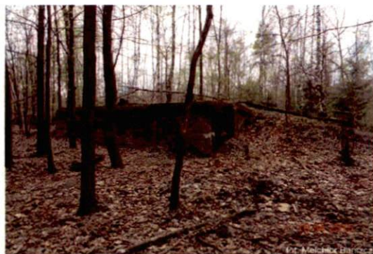
Zdjęcie nr 99. Widok od zachodu