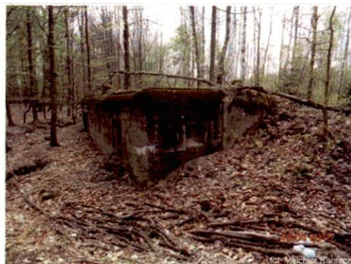
Zdjęcie nr 98. Widok od północnego-wschodu