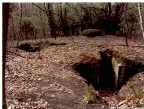
Zdjęcie nr 101. Widok od zachodu

4. Adres Zapolskiej Gabrieli --(w lesie) dz. 2.259/7