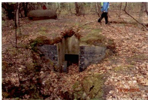
Zdjęcie nr 102. Widok od południa