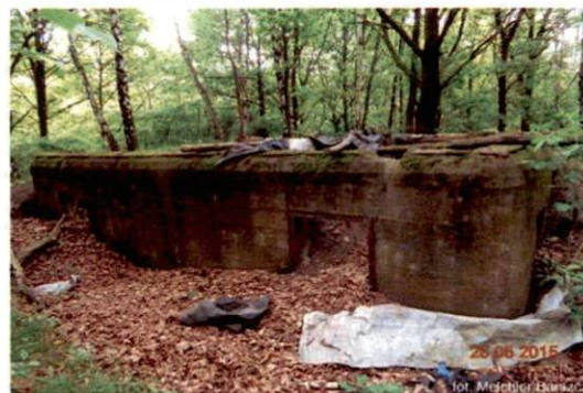
Zdjęcie nr 106. Widok od południa