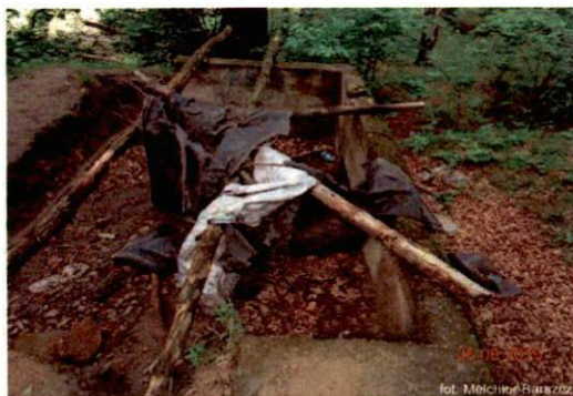
Zdjęcie nr 107. Widok od wschodu