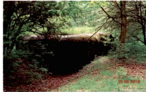
Zdjęcie nr 108. Widok od północy

4. Adres Iskiej -- Orzeszkowej (w lesie) dz. 1.1208/81 Kod pocztowy 41-700 Nr ewidencyjny działki: 1.1208/81