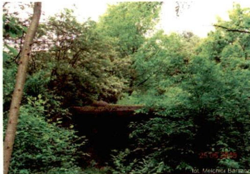
Zdjęcie nr 109. Widok od południa